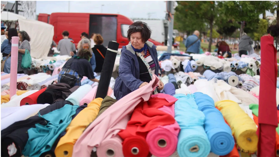
Una muje rojea entre las distintas telas de un puesto del rastro.

El mercadillo, desde mayo de 2021, se ubica en la barriada de Marismas del Polvorín , entre las calles Calatilla, Choza, Gravera y Salinas, una zona con la que "la mayoría de personas de Huelva y alrededores están muy contentos", esa es la impresión de Nilson, uno de los vendedores que este domingo ha vuelto a montar, puntual como siempre, su puesto en el mercadillo. "El mercado de Huelva es el más importante que tenemos la mayoría de nosotros, el domingo es el día que vienen más personas y es el que vienen más afluencia", por lo que este cambio ha motivado cierta confusión por este posible cambio.