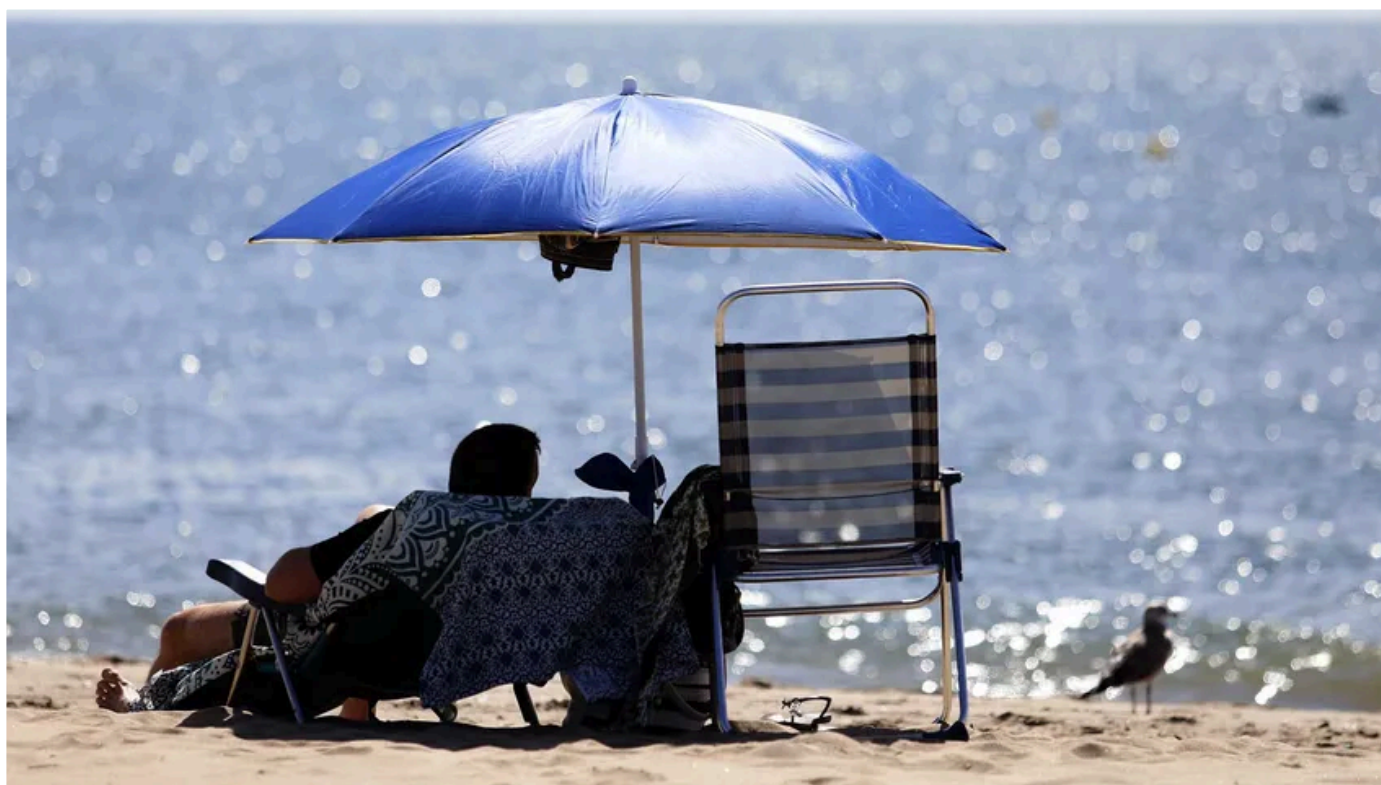
La Aemet avisa de un "subidón" térmico con temperaturas de 30 grados