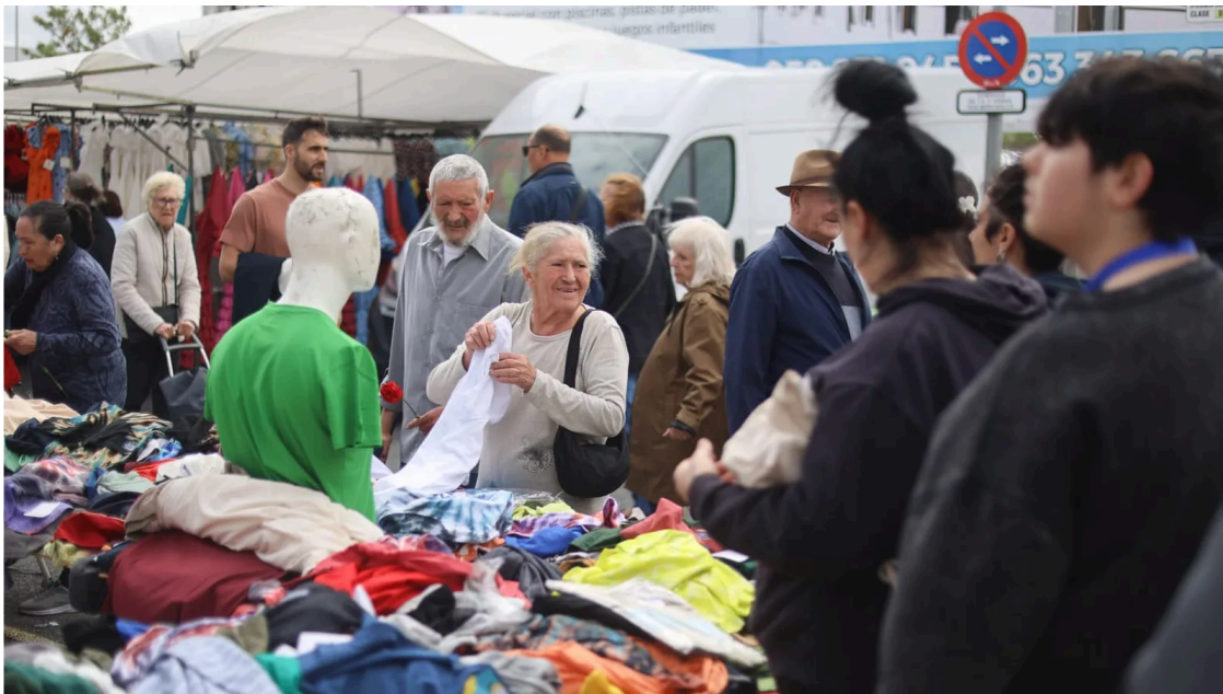
Personas realizan sus compras en el rastro de Huelva.

Desde su puesto de textil, David reivindica que "esto es un trabajo más, aunque no esté bien mirado" por lo que pide que la decisión de cambiar la ubicación y el día del mercadillo tenga en cuenta a los vendedores. Este trabajador lamenta que puedan perder su trabajo por " cuatro quejas de egoístas " que podría hacerles moverse a una nueva ubicación que no sea tan idónea como en la que se encuentran ahora.