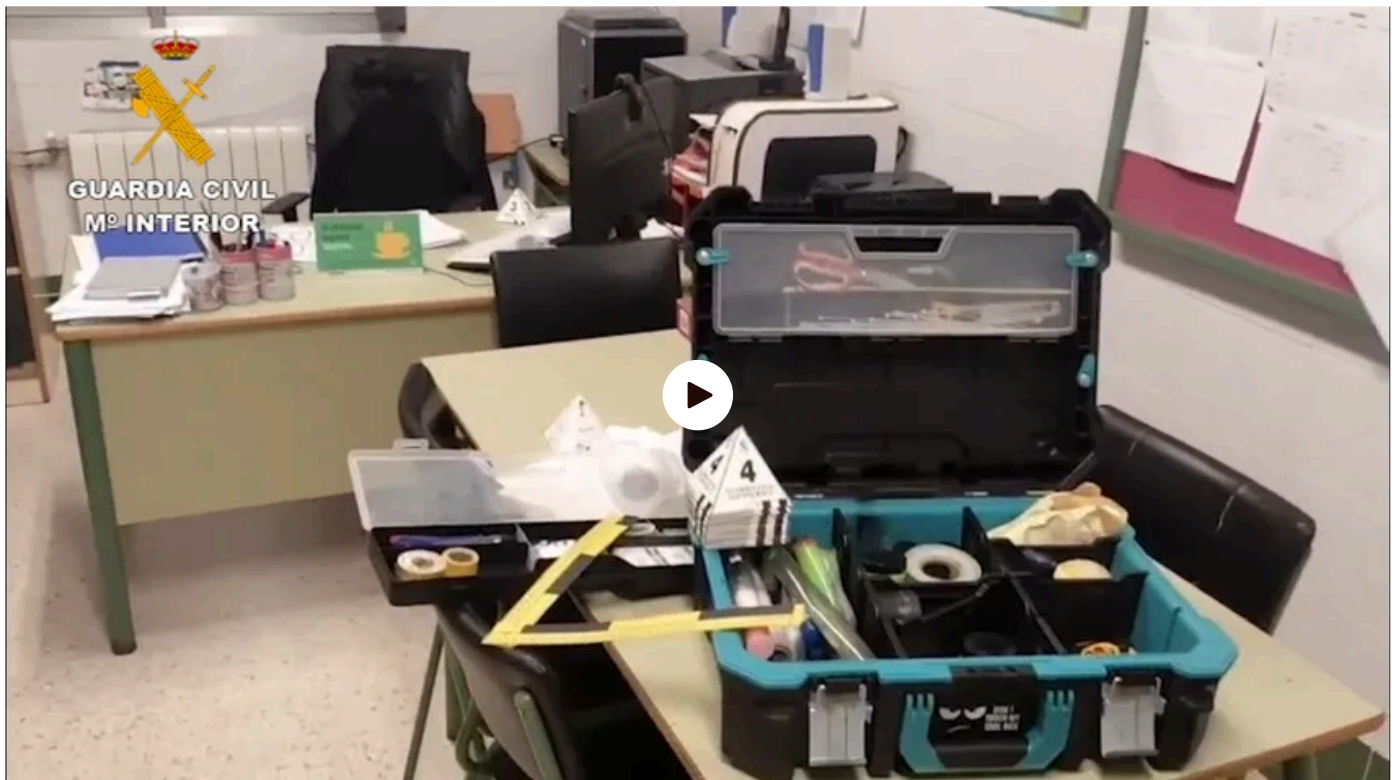
Cuatro detenidos por robar el dinero de las excursiones del CEIP Miguel de Cervantes