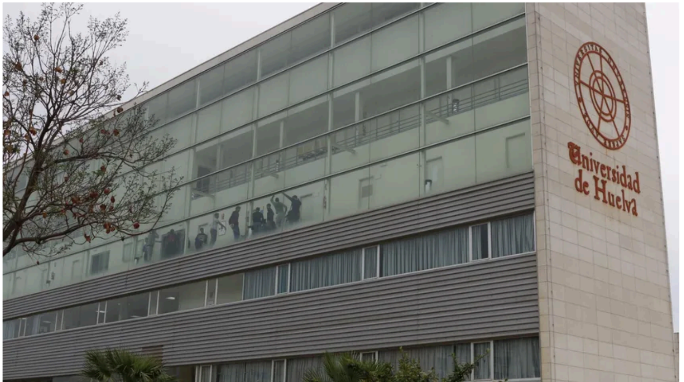
Logran fabricar cerámica sostenible a partir de residuos de fosfoyesos