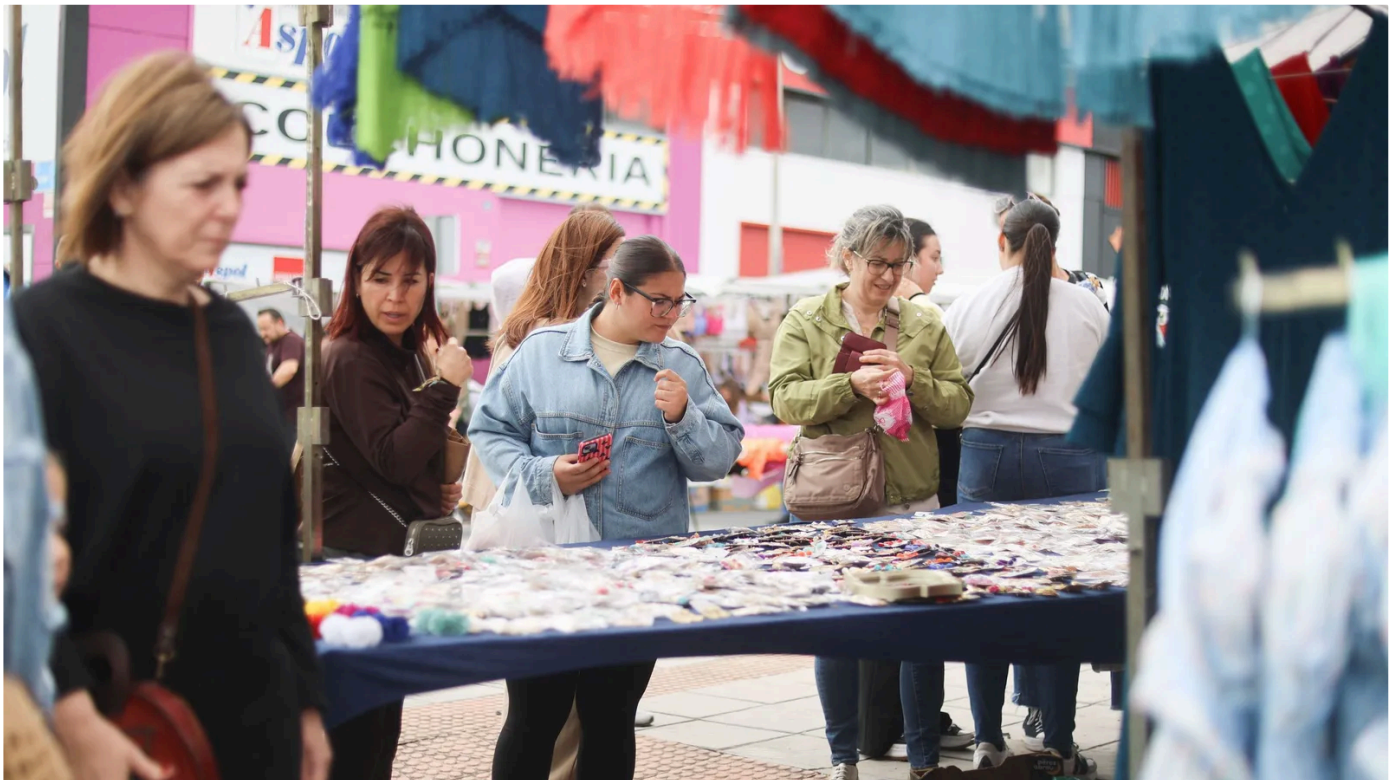
Gran ambiente en la mañana de este domingo en el mercadillo.

La Ordenanza del Comercio Ambulante de Huelva se modificará y se reubicará el mercadillo