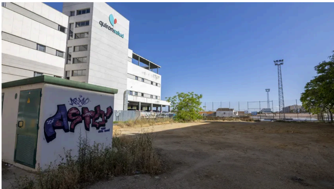
El Ayuntamiento inicia trámites para ceder a vecinos de Nuevo Molino un aparcamiento