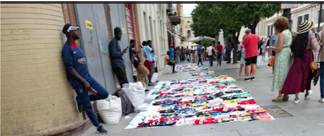
Manteros en la Avenida de la Constitución durante el puente de mayo