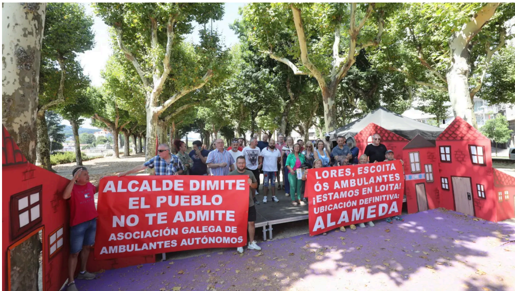
Concentraci3n de los feriantes. DAVID FREIRE