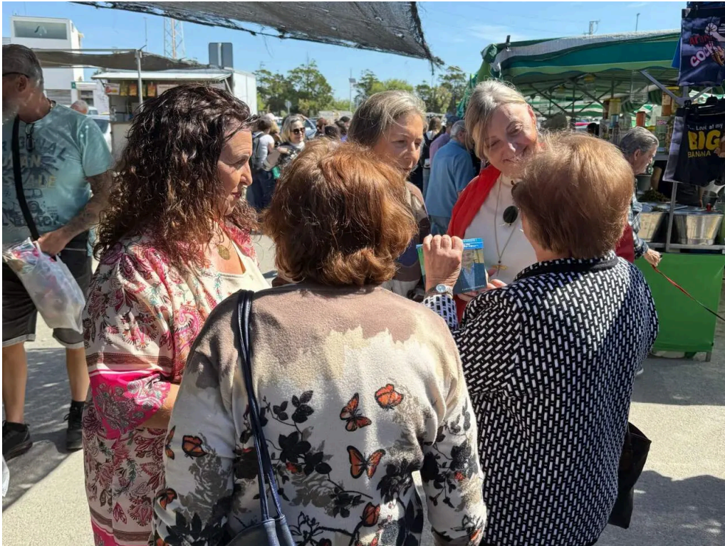
El PP pide explicaciones sobre ayudas al comercio ambulante.

Los populares reclaman conocer si el Consistorio ha solicitado subvenciones de la Junta para mejorar los mercadillos y atender las demandas del sector