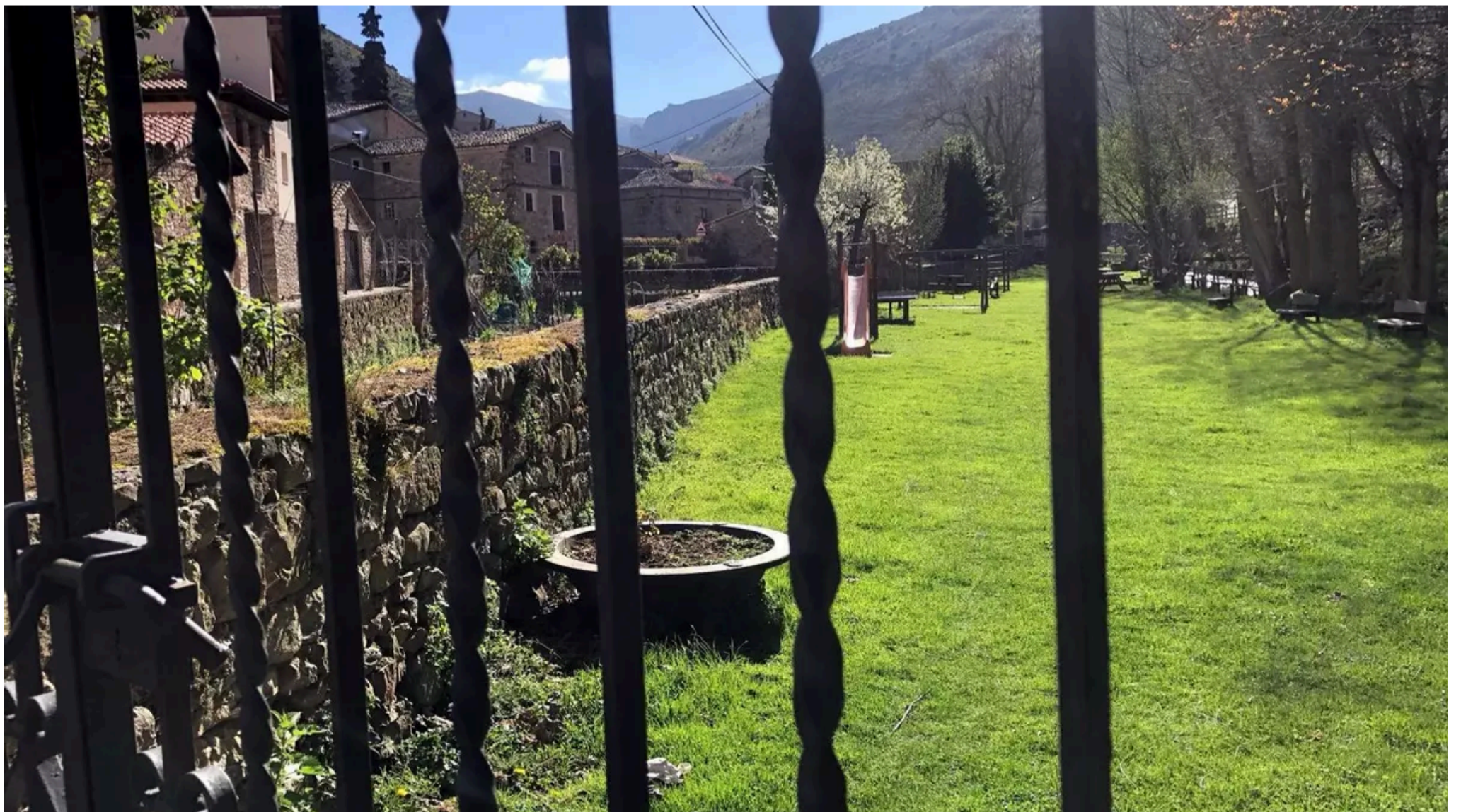
Pueblo de La Rioja